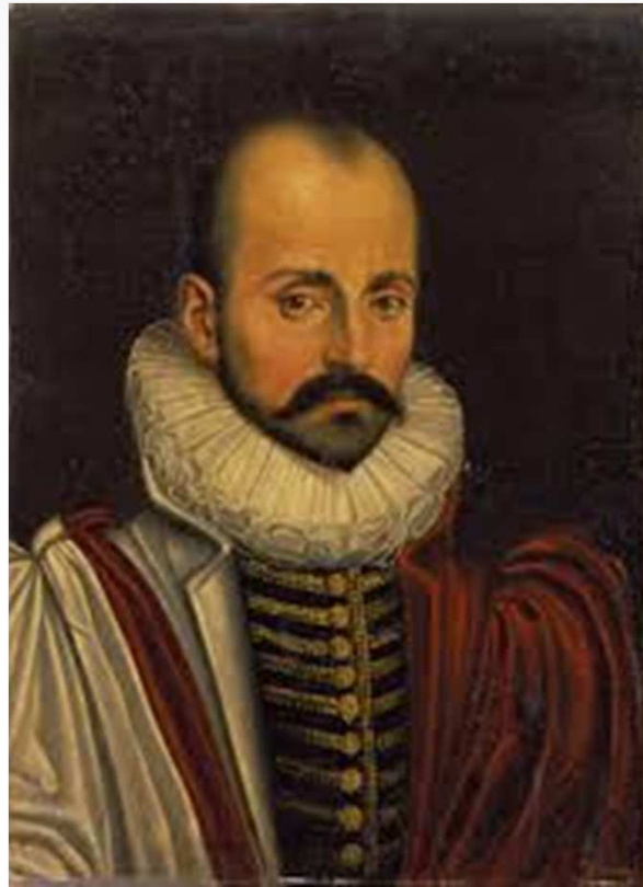
Unidade 1: O Homem

Montaigne (1533-1572) escreveu sobre os índios Tupinambá, encontrados no Brasil no período colonial